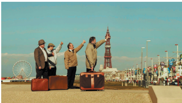
▲ 4 niesłyszących z Yorkshire jedzie do Blackpool