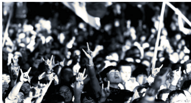
▲ Mój tata rockman